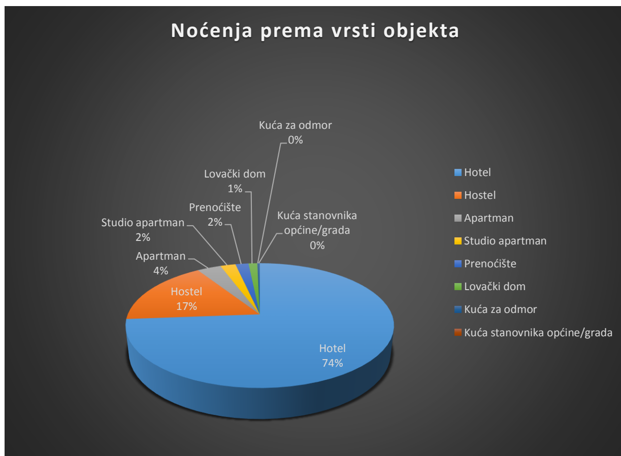
Graf 1: Noćenja prema vrsti objekta